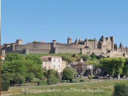
© Dominique Verdure : Les Films de l'Aqueduc